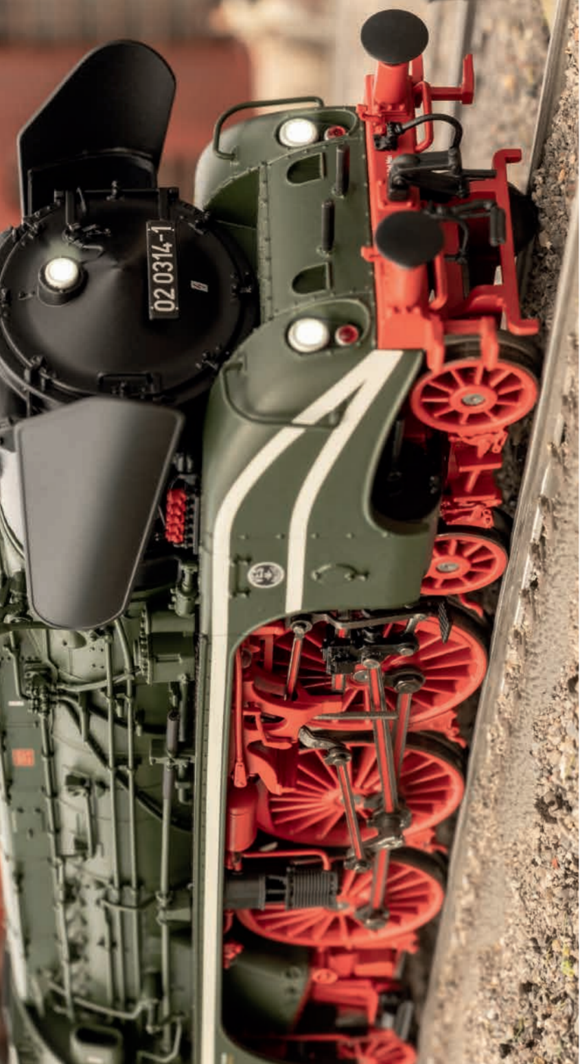
Foto zeigt erstes Handmuster The photo shows the first hand sample